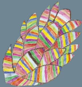
Leon Medved, 3. A