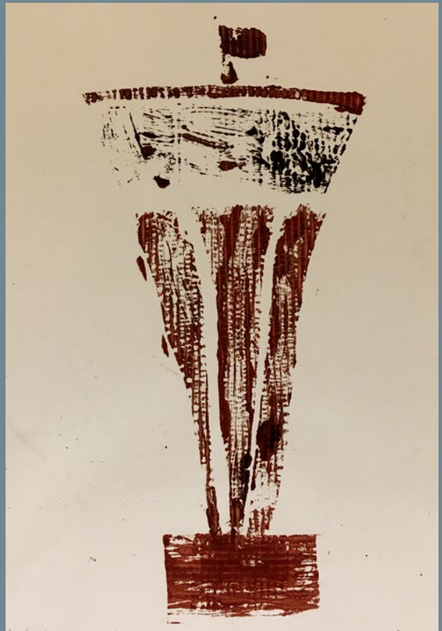
Petra Bukovac, 6. A