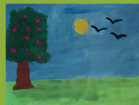
Autorica likovnog rada: Nikolina Bošnjak

Učenička je zadruga ove godine bila izrazito aktivna i svestrana. Gljivari su uzgajali, brali i prodavali bukovače, učili su prepoznavati razne gljive, izrađivali prezentacije i rješavali kvizove. Članovi Eko-sekcije izrađivali su vjenčice za božićni sajam i uzgajali pšenicu, izrađivali plakate o aktualnim temama (požari u Australiji) te privjeske i bedževe za Dan škole, a tijekom nastave na daljinu nastala je i pjesma Eko oda prirodi .